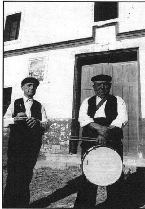
Ermita del Calvari. 4 de març de 1981. Cedida per Eduard Caballer.